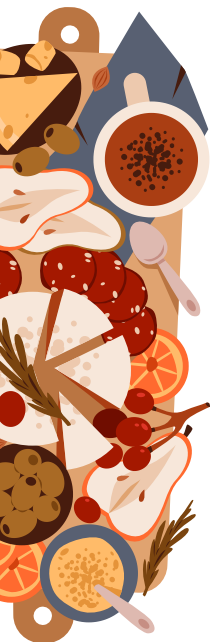
Planche des Alpes ——— 20€

Duo de charcuterie et fromages des Alpes, tranchés par nos soins